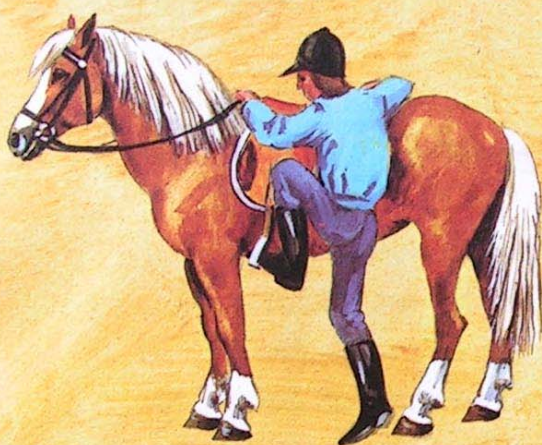
1. do třmenu zasuneme špičku levé nohy...