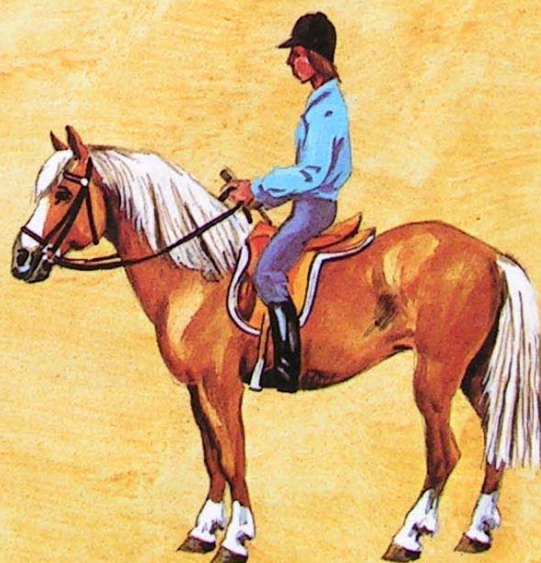
4. a měkce dosedneme do sedla