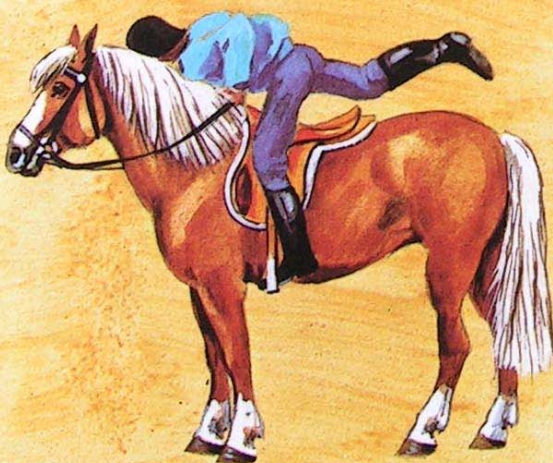
3. pravou nohu přehodíme přes hřbet koně...